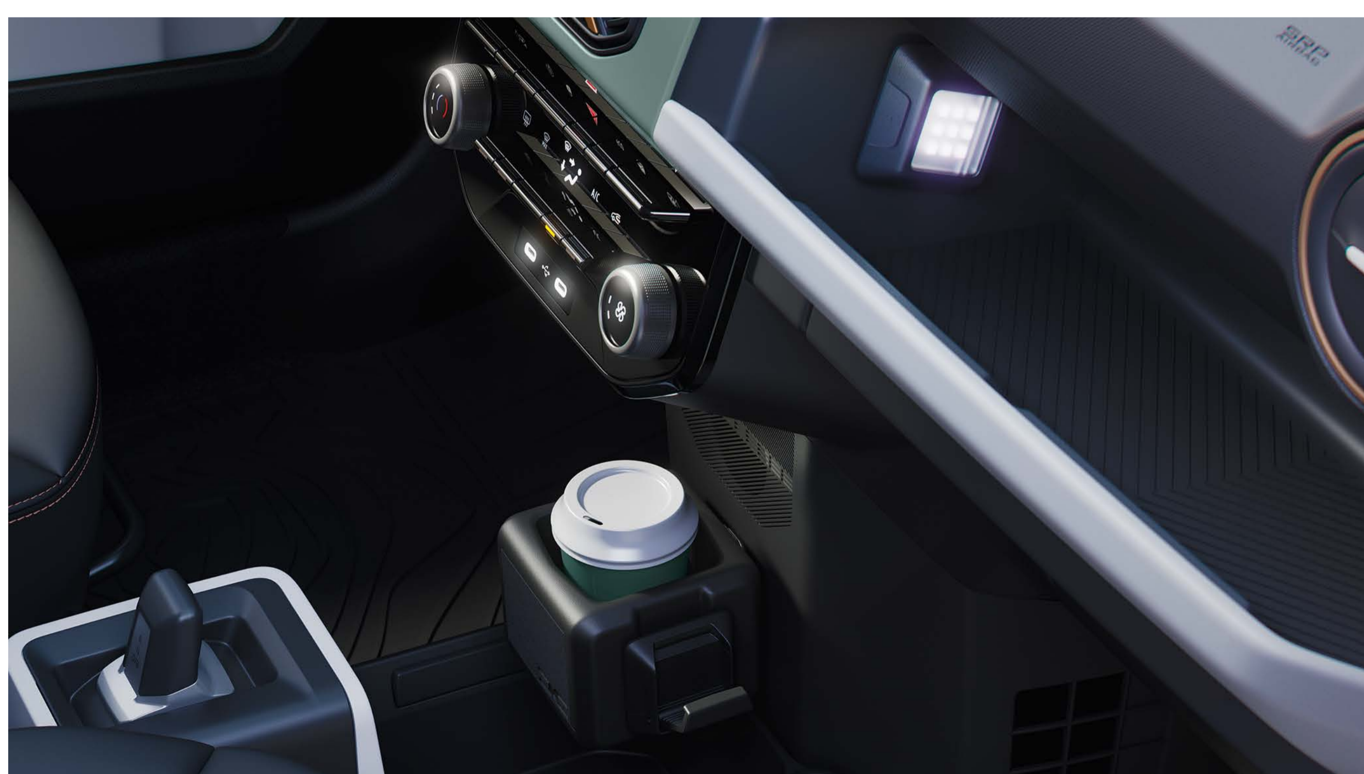
Accessorio 3-in-1 YouClip (luce, portabicchieri, appendino)

Nuova Dacia Spring è stata concepita per semplificarti la vita, grazie ai suoi 308 litri di bagagliaio, il più ampio della categoria, e all'ingegnoso accessorio 3-in-1 YouClip.