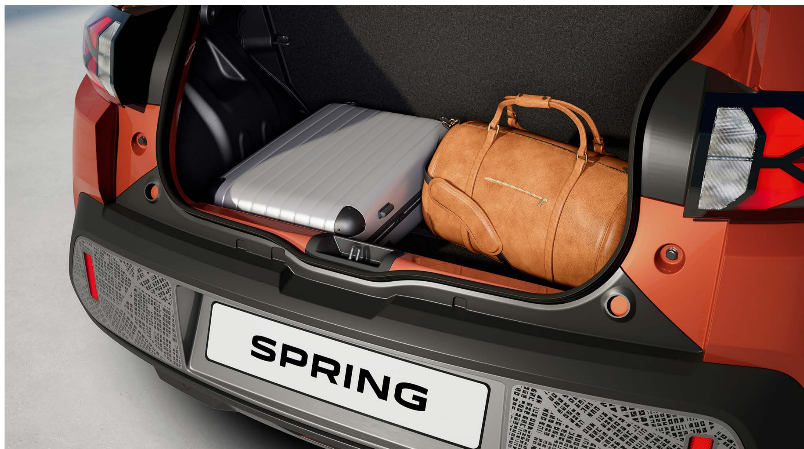
Bagagliaio da 308 litri/288 dm 3 (standard VDA)