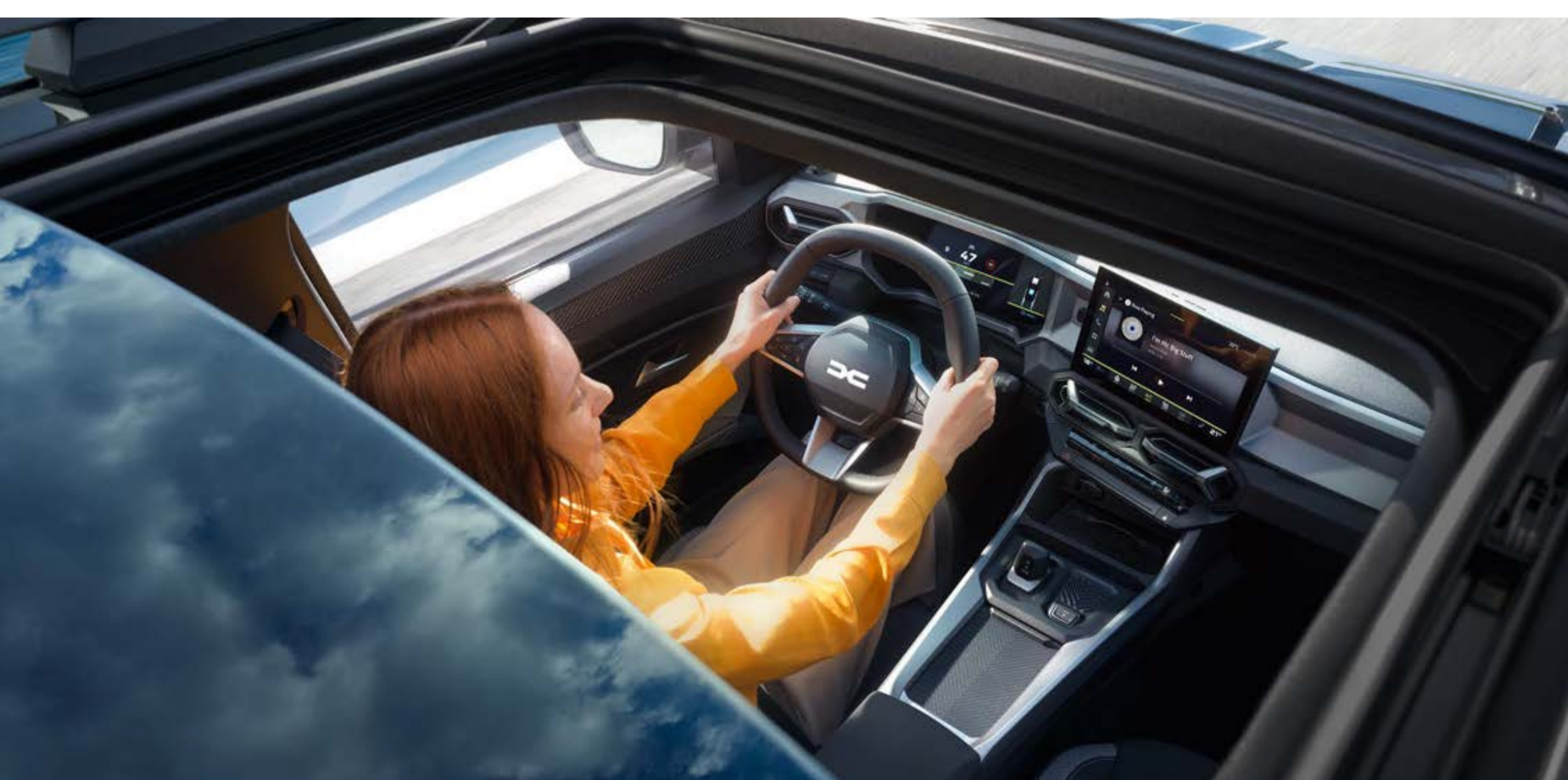
Tetto apribile panoramico

La versione con bi-tono (tetto in nero) e la distintiva tinta Blu Indigo ne esaltano l'eleganza, che si completa con il tetto apribile panoramico capace di garantire una luminosità interna impeccabile. C'è un Bigster perfetto per ogni tua esigenza.