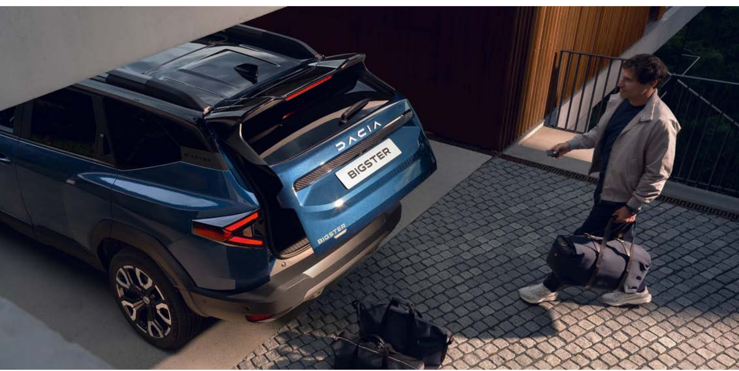
Portellone posteriore elettrico