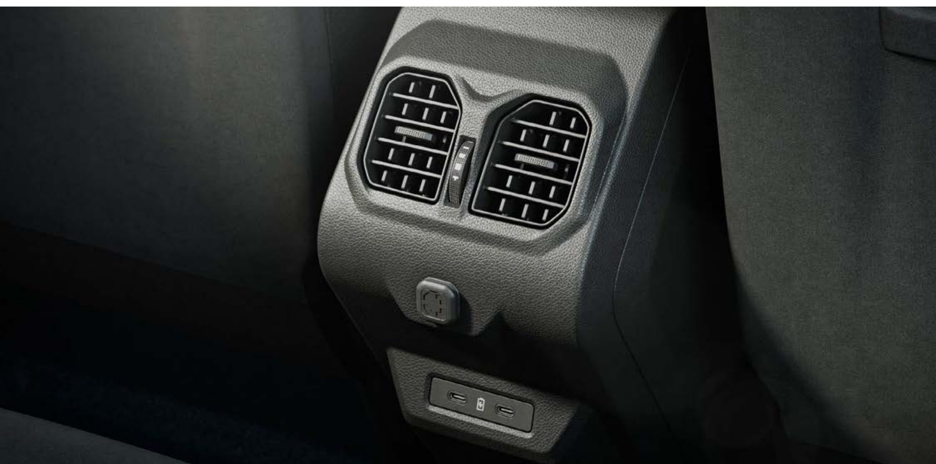
Bocchette di ventilazione posteriori