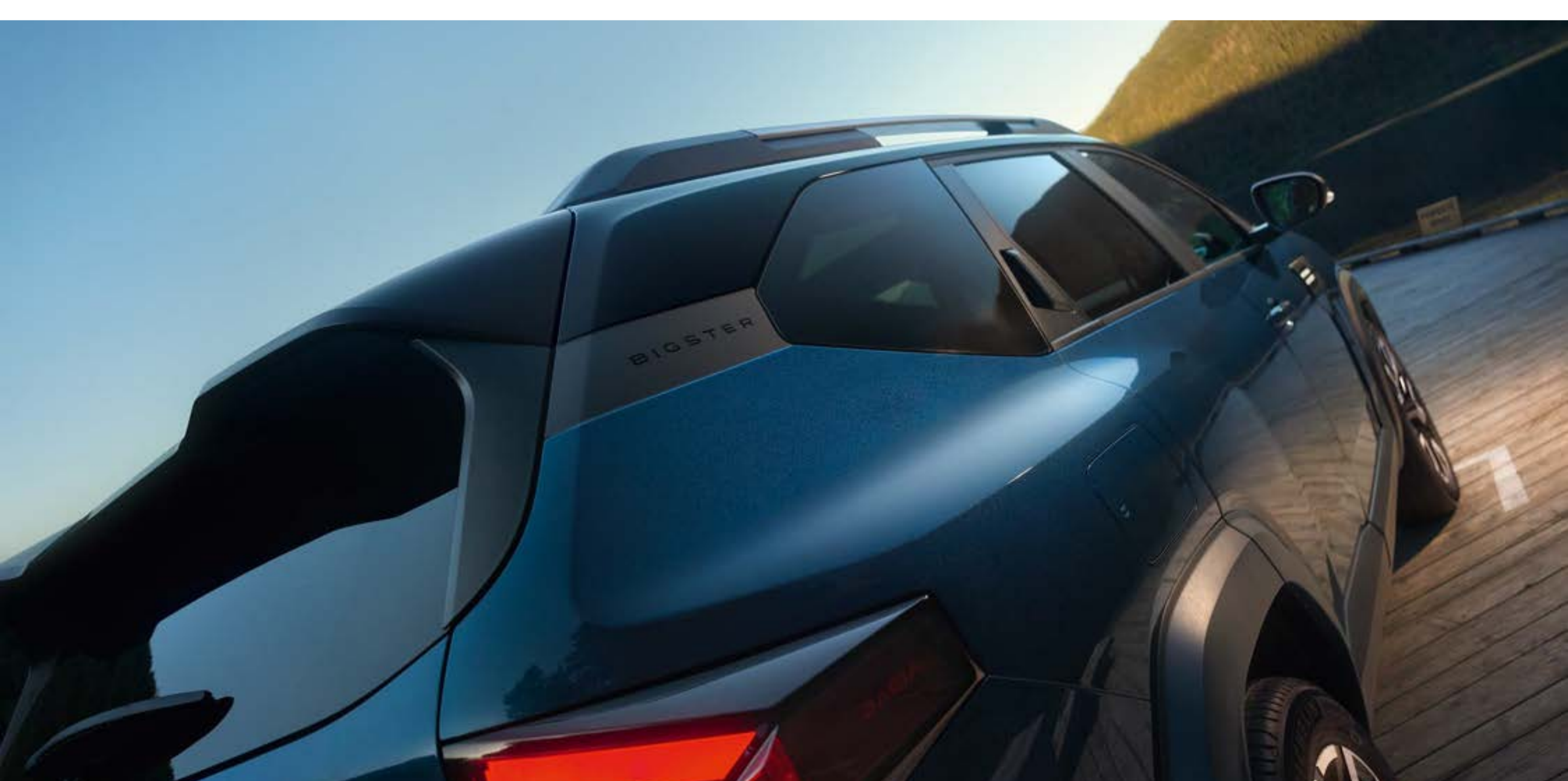
Esclusiva tinta bicolore