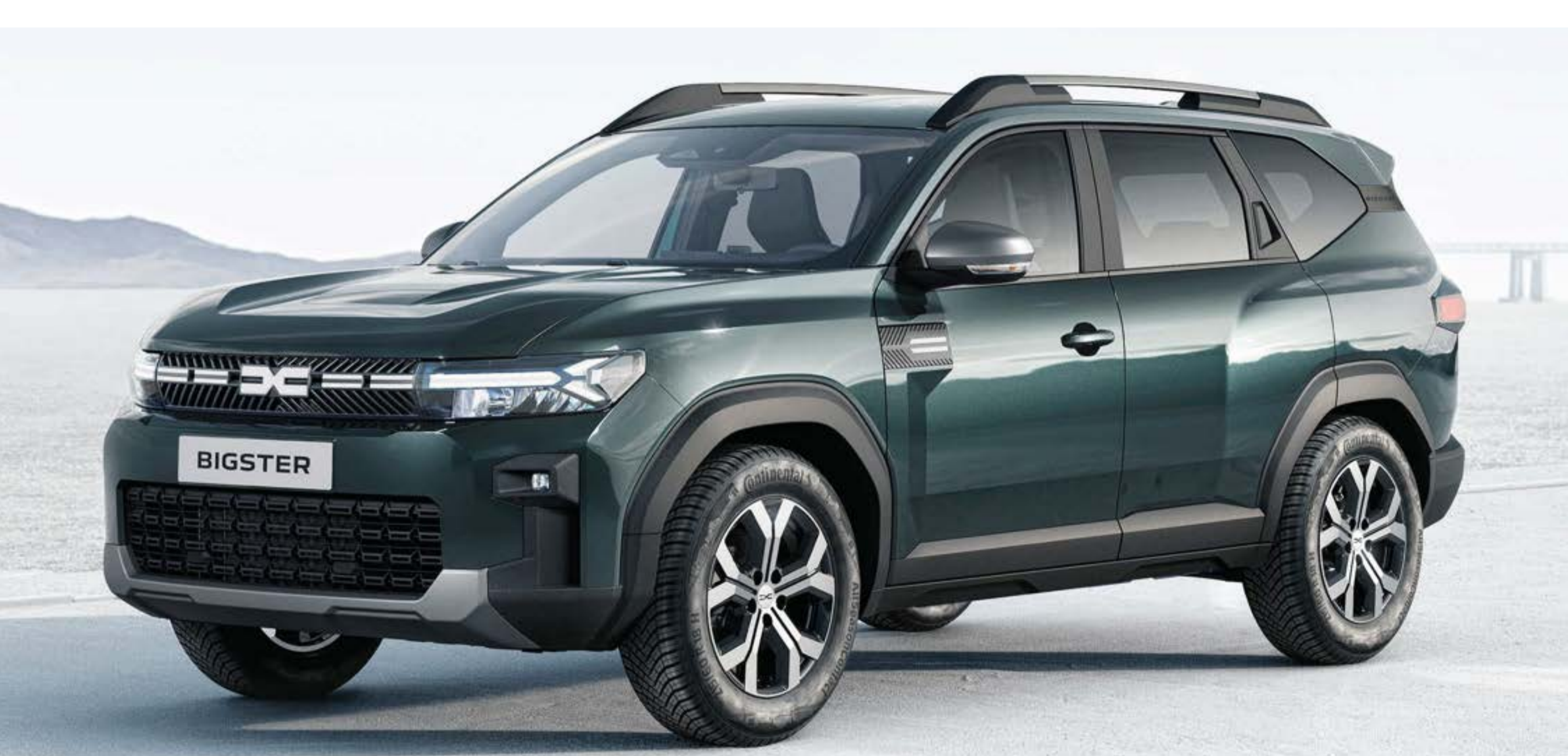
VERDE OXIDE (2)