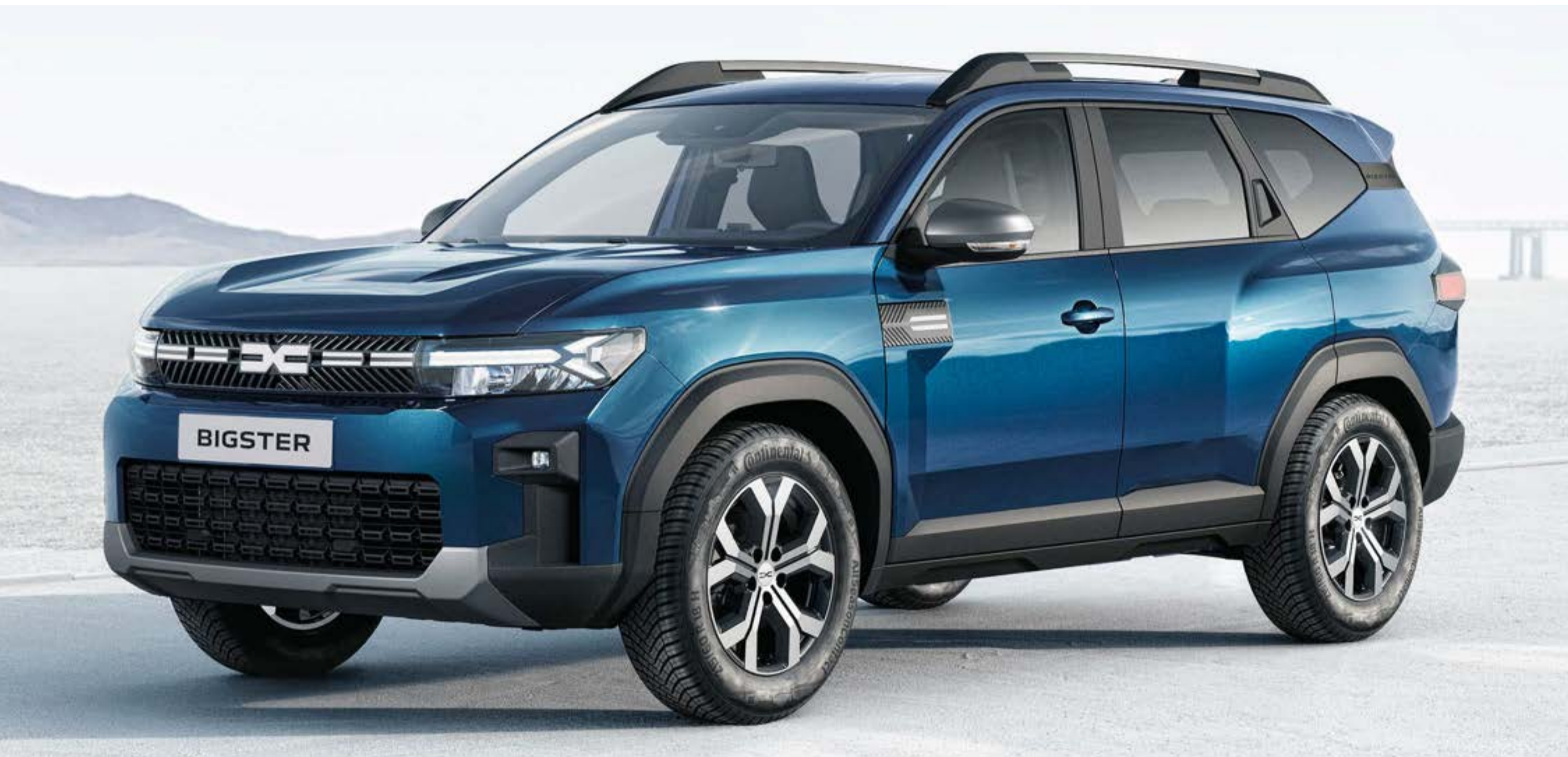
BLU INDIGO (2)