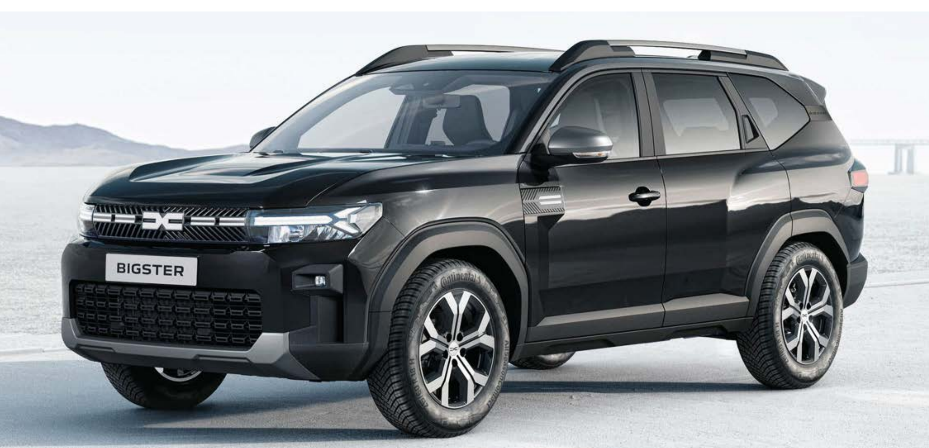
NERO NACRÉ (2)