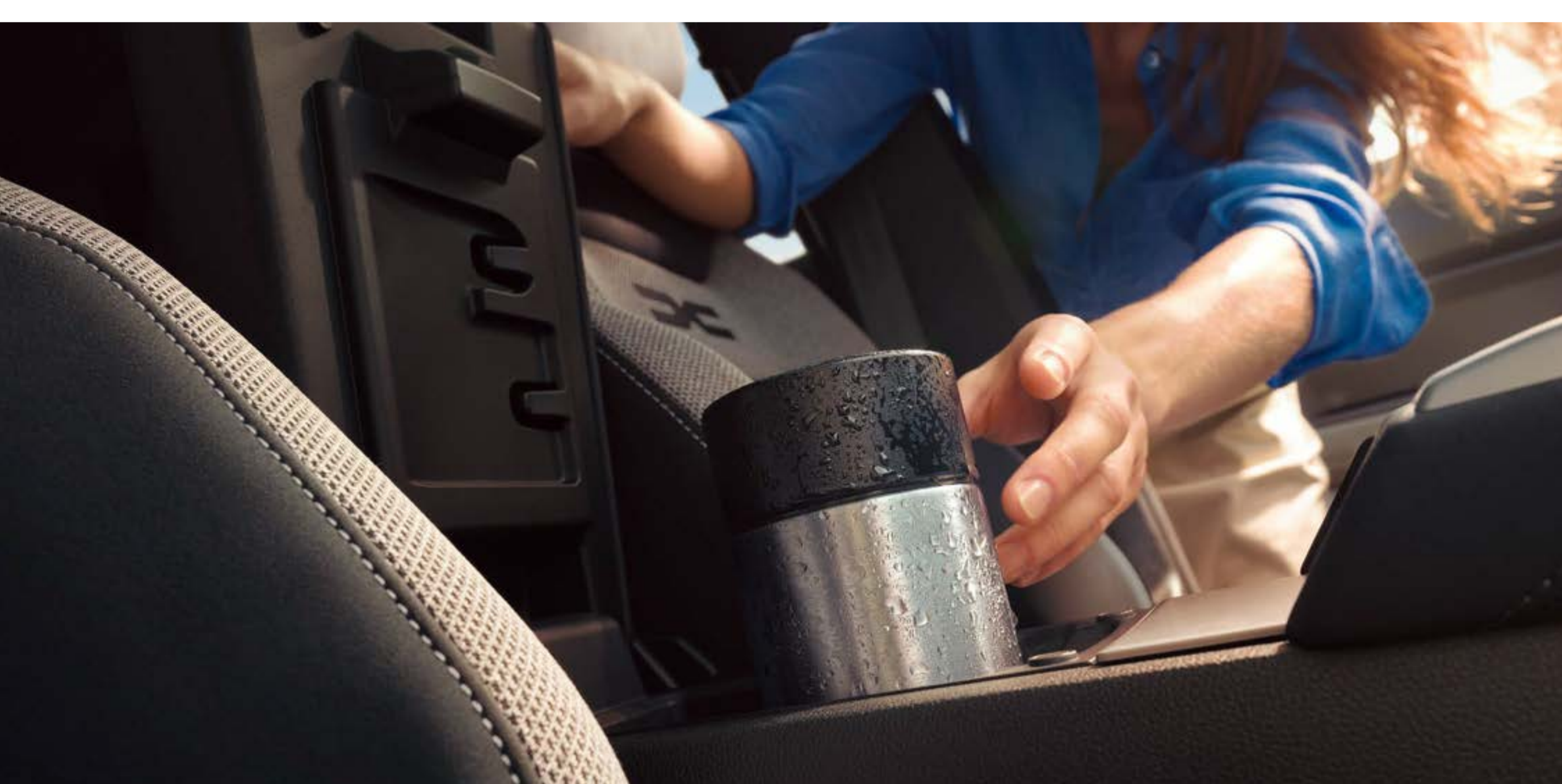
Vano portaoggetti refrigerato