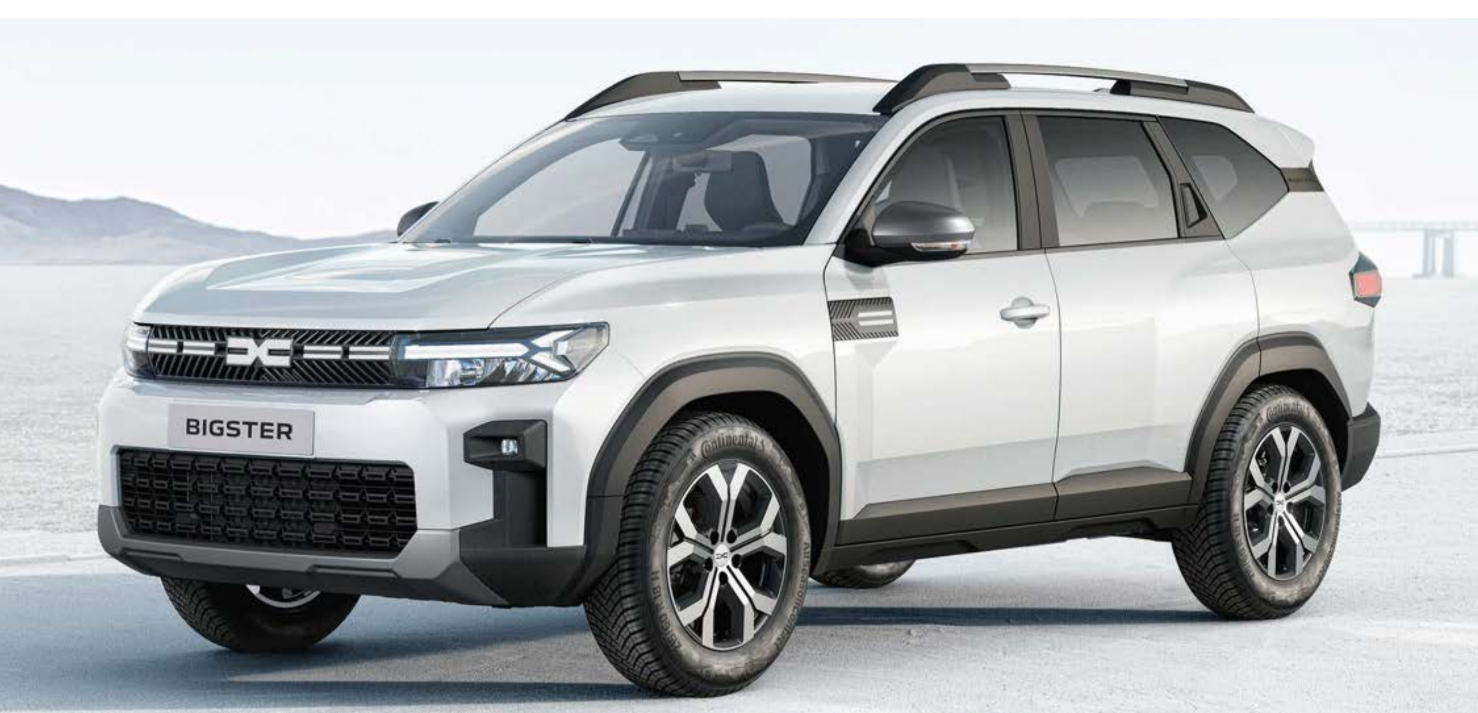
BIANCO GHIACCIO (1)