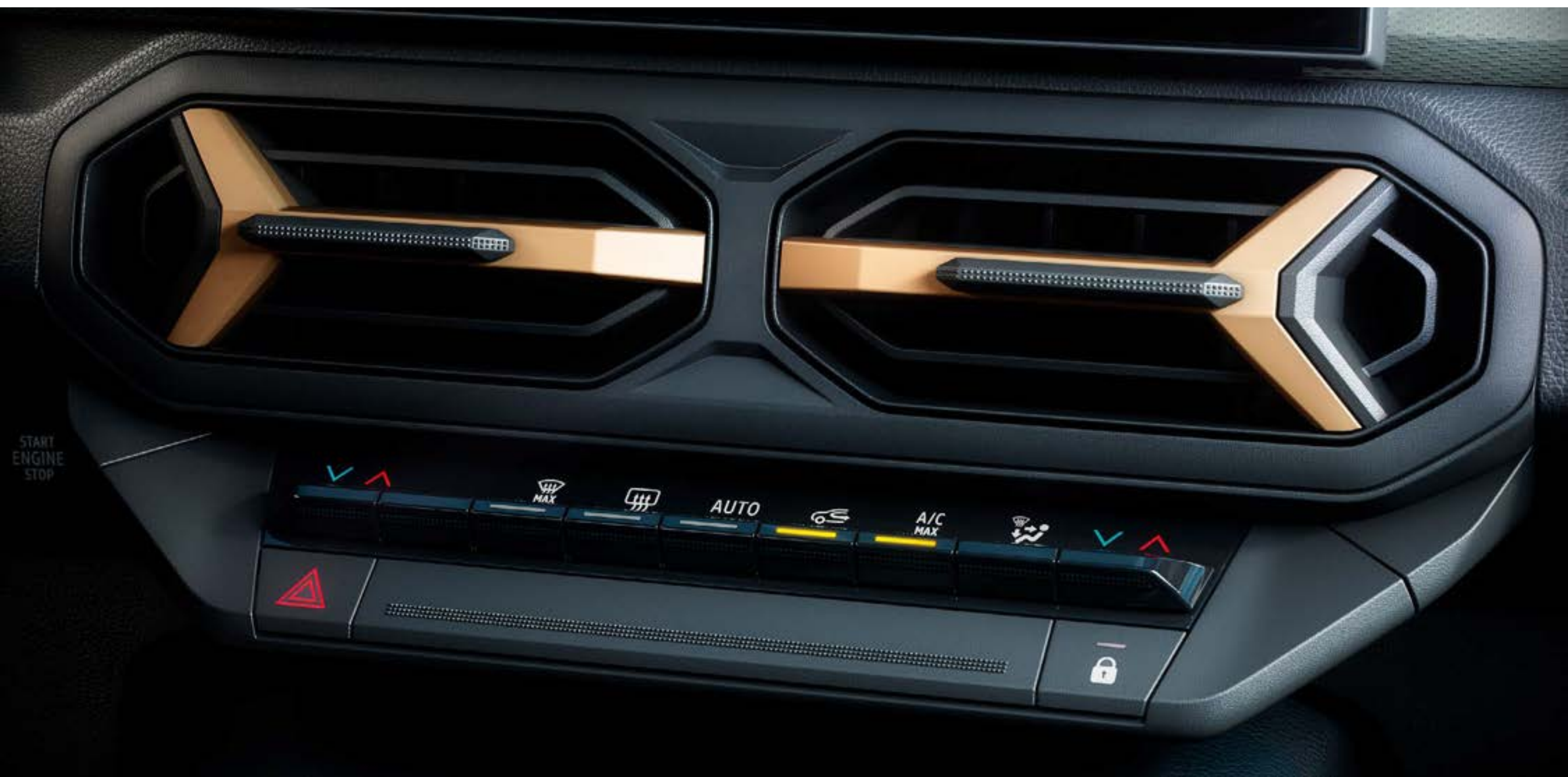
Climatizzatore automatico bi-zona

Progettato per garantire il massimo comfort a cinque passeggeri, l'abitacolo gode di un livello ottimizzato di insonorizzazione che ti permette di apprezzare la qualità sonora del sistema audio Arkamys® 3D con sei altoparlanti, mentre il climatizzatore automatico bi-zona con bocchette di ventilazione dedicate ai sedili posteriori assicura il benessere di tutti gli occupanti.