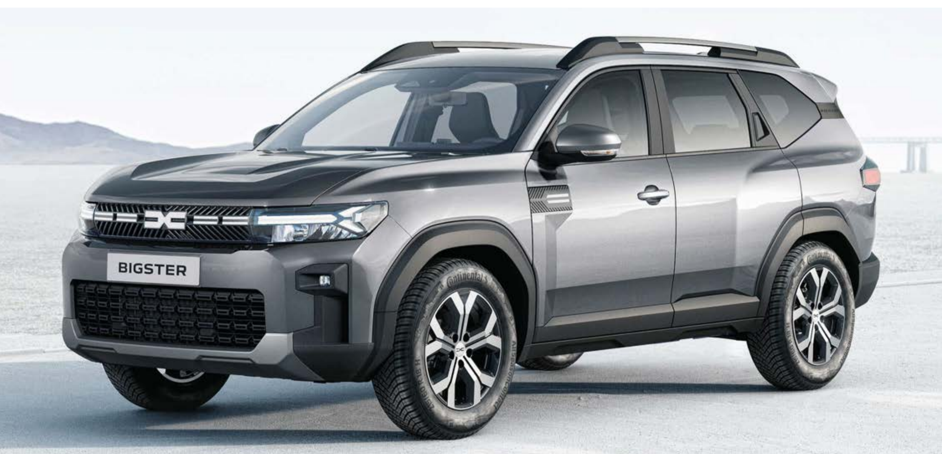
GRIGIO SCISTO (2)